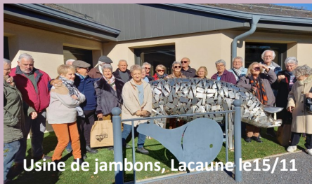
Usine de jambons, Lacaune le 15/11

Le 8 décembre, le marché de Noël nous a permis d'exposer et de vendre des créations faites par les membres du club.