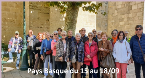
Pays Basque du 15 au 18/09

Le dernier trimestre a été marqué par plusieurs événements, une sortie au Pays Basque en septembre, un spectacle de danses Tahitiennes, en octobre au Cap d'Agde et une visite à l'usine de jambons en novembre avec dégustations de châtaignes.