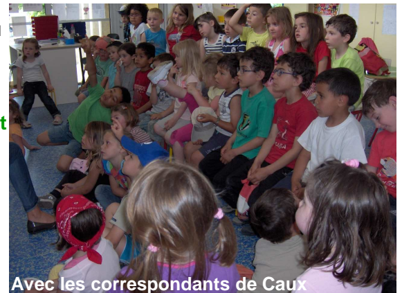
Avec les correspondants de Caux