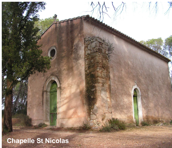
Chapelle St Nicolas

Le 17 et 18 Septembre - Journées Européennes du Patrimoine : Visite théâtralisée du Village (association Les Roses-Moustiques) et conférences à la Maison du Peuple.