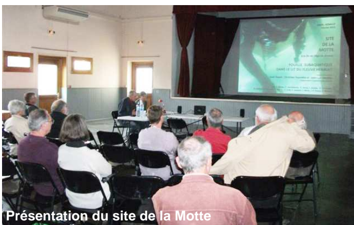
Présentation du site de la Motte

Au cours de ces deux journées, les participants ont pu