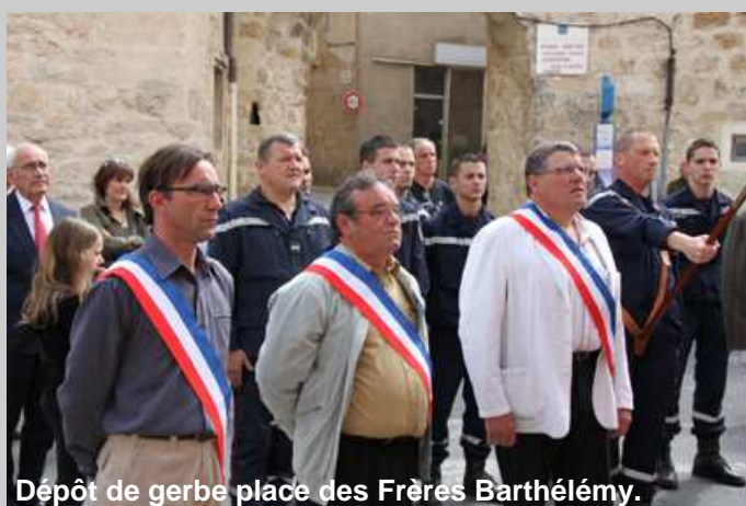
Dépôt de gerbe place des Frères Barthélémy.